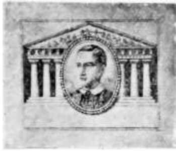
Fig.10: Het unieke Nicolaïdes-exemplaar

Dan is er type Ib. Dit bestaat volgens hem in 20 kleuren, 10 gegraveerd en 10 in litho uitgevoerd. Daarbij geeft hij aan dat van het type Ib de markt in 1898 werd overspoeld met slecht gemaakte reproducties. Ik noem ze type Ic. Type Ic is eenvoudig te herkennen aan de letter Gamma in het woord Gramm. dat een haakje heeft, in tegenstelling tot type Ia en Ib.