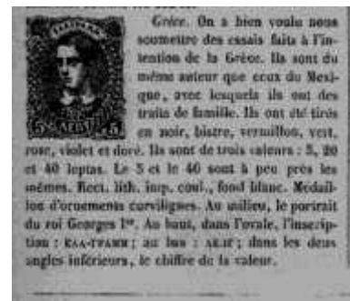
Fig.4: Detail tekst Le Timbre Post juni 1864

Het tweede type essay wordt volgens de bestaande literatuur voor het eerst gemeld in het juli nummer van 1864 van Stamp-Collector's Magazine , ditmaal zonder afbeelding. Le Timbre Poste heeft ze echter al een maand eerder in het tijdschrift, met illustratie. Moens schrijft: "Men heeft ons essays voorgelegd, bestemd voor Griekenland. Ze zijn van dezelfde maker als die van Mexico (JM: ik kom hier op terug in de volgende paragraaf), waarmee ze de nodige overeenkomsten hebben. Ze zijn gedrukt in zwart, bistre, vermillon, groen, rose, violet en doré. Ze hebben drie waarden : 5, 20 et 40 leptas. De 5 en de 40 lijken op elkaar. Rechthoekig, in litho gedrukt in kleur op blanke ondergrond. Dan volgt nog een beschrijving van de afbeelding. Moens sluit af met de conclusie dat deze essays beter gelukt zijn dan de andere (van het type I).