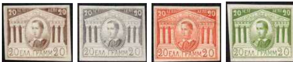
Fig.5a-d: Voorbeelden van type I

Louis Fanchini geeft in zijn artikel aan dat de makers van de essays niet bekend zijn. Met betrekking tot het essay van het type I kom ook ik niet verder dan dat het ontwerp waarschijnlijk in Parijs is gemaakt. De enige die nog iets meer over de makers van dit type essay heeft gezegd is Nicolaïdes. Hij stelt dat de graveur van deze zegel woonde dichtbij wat nu de Place de la Republique is, maar verder geeft hij geen details.