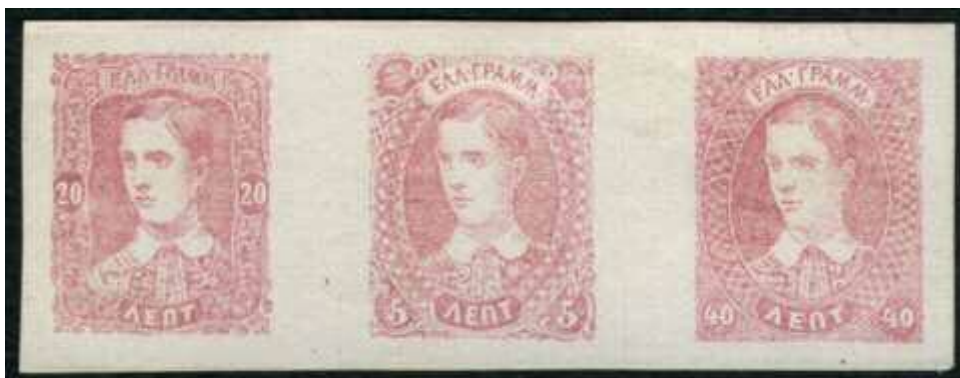
Fig.8: Ronchi essays, type II

De ontwerpen van deze laatste vertonen opvallend veel overeenkomsten met het essay type II van Griekenland. De gebruikte kaders, de kleuren en de samenhang van de essays in velletjes vormen naar mijn idee voldoende bewijs om aan te nemen dat hij de ontwerper is