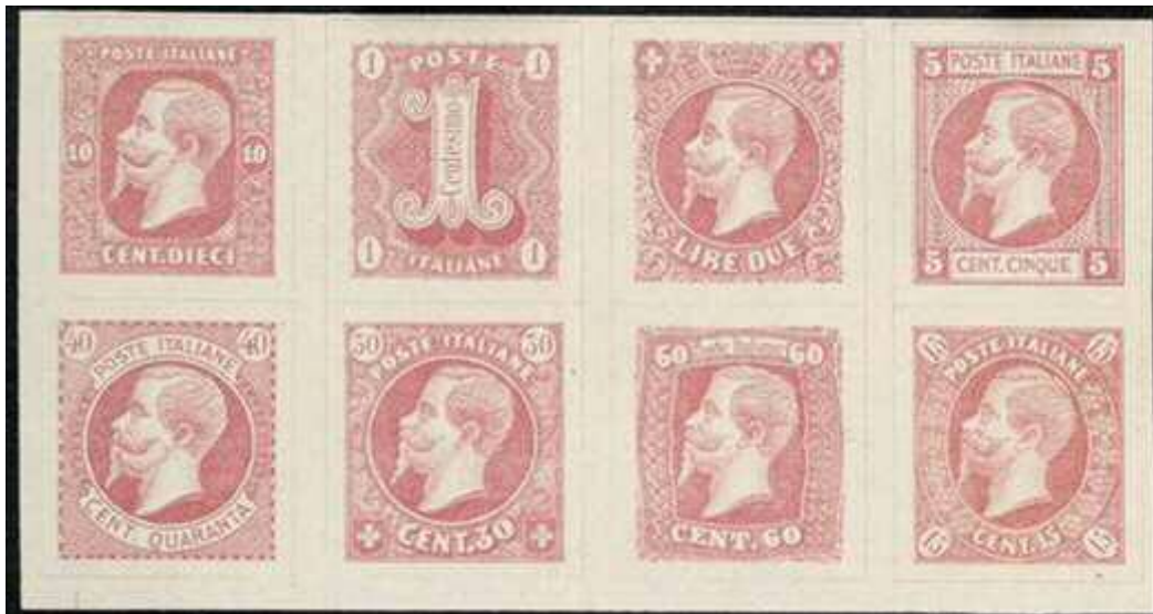
Fig.7: Ronchi essays voor Italië (1863)

Nu waren er in Milaan op dat moment in ieder geval twee drukkers actief met het ontwerpen van postzegels. In 1861 was het Koninkrijk Italië uitgeroepen en had koning Victor-Emanuel de troon bestegen. Een aantal drukkers leverde daarna, op verzoek van de Italiaanse post, ontwerpen aan voor postzegels voor het nieuwe koninkrijk. Hieronder waren de twee Milanese drukkers, Francesco Grazioli (Wench), die in april 1862 zijn ontwerpen aan de post aanbod en Luigi Ronchi, die in juli 1863 met zijn essays verscheen.