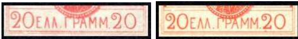
Fig.11a-b: Gamma, type Ib en Gamma, type Ic

Dan is er type Ib. Dit bestaat volgens hem in 20 kleuren, 10 gegraveerd en 10 in litho uitgevoerd. Daarbij geeft hij aan dat van het type Ib de markt in 1898 werd overspoeld met slecht gemaakte reproducties. Ik noem ze type Ic. Type Ic is eenvoudig te herkennen aan de letter Gamma in het woord Gramm. dat een haakje heeft, in tegenstelling tot type Ia en Ib.