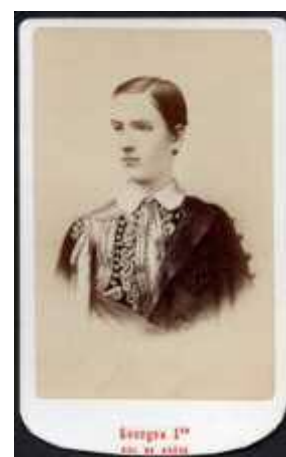
Fig.2 Het portret van de jonge koning dat als voorbeeld diende voor de “essays”

In oktober 1862 werd de uit Beieren afkomstige koning Otto van Griekenland na een opstand gedwongen afstand te doen van de troon. Een onrustige tijd volgde waarin naar een opvolger werd gezocht. Nadat andere kandidaten waren afgevallen werd uiteindelijk op 18/30 maart 1863 Prins Willem van Denemarken, 17 jaar oud, door het Griekse parlement gekozen tot Koning der Hellenen. Hij kreeg de officiële naam koning George I. Op 18/30 oktober 1863 arriveerde hij in Athene om uiteindelijk koning te blijven tot hij in 1913 werd vermoord.