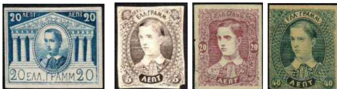
Fig1a en 1b-d: Type I en type II van de essays

Wanneer u wel eens een gemengd partijtje Griekse postzegels koopt op een veiling of door de dubbelen-boeken bladert heeft u ze vast wel eens gezien, die vrolijk gekleurde ongetande zegels met de afbeelding van een jongeman en de voorkant van een tempel. Dit zijn de zogenaamde “essays” van koning George I van Griekenland. In de Vlastos catalogus is voor deze zegels een plek ingeruimd (Vlastos 2012, U1 en U2). Ik zal hem verder aanduiden als essay type I. Daarnaast is nog een tweede variant in de catalogus opgenomen (U3-U5) met dezelfde jongeman, maar nu zonder tempel. Deze zal ik verder aanduiden als type II. De Vlastos catalogus vermeldt dat het bij beide zegels gaat om “unofficial Issues”.