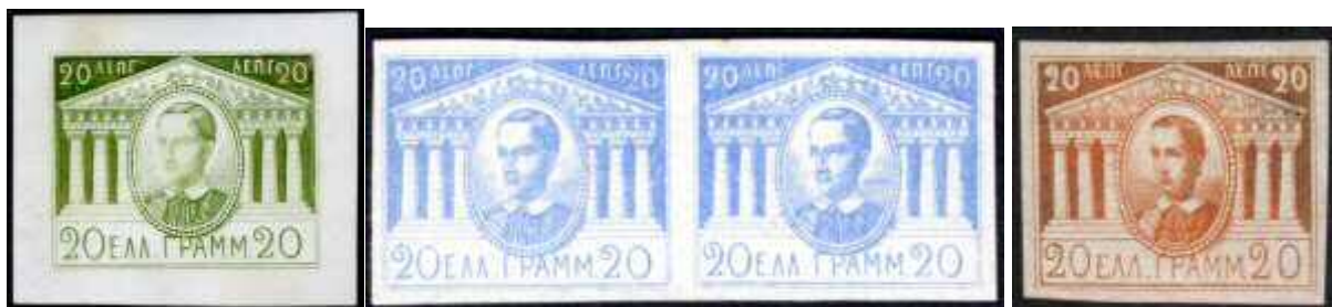
Fig.9a-c: Type Ia en Ib en ter vergelijking type I

Glasewald noemt als eerste een nieuwe variant van het essay type I. Hierin heeft de koning een wat breder hoofd, is het medaillon wat breder en minder hoog, en de zuilen van de tempel van het Parthenon ogen wat degelijker. Hij vermeldt van deze variant van het zegel een uitvoering in staalgravure op wit karton, die hij alleen in blauw kent, en een litho-uitvoering in maar liefst 16 kleuren. Ik zal ze verder met type Ia (wit karton) en type Ib aanduiden.