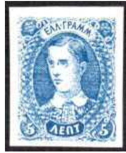
Fig.13: Type II, 5 lepta, grovere uitvoering op dik wit papier