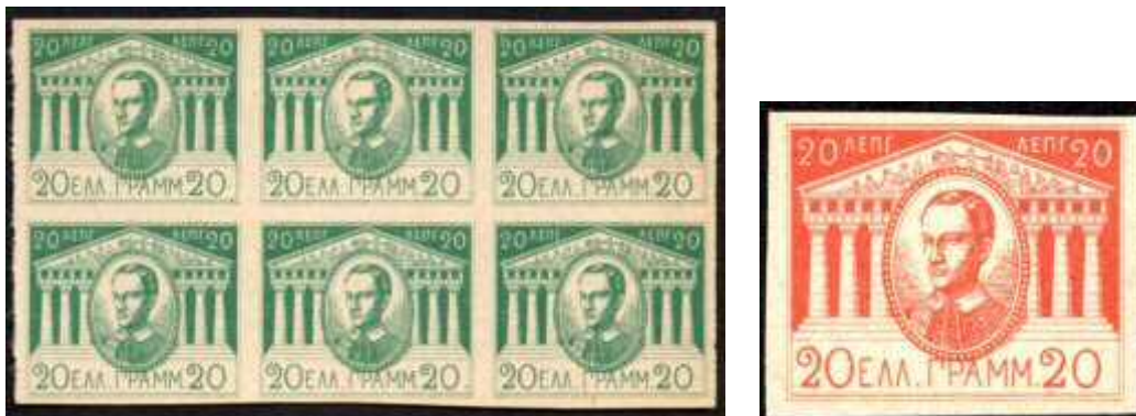
Fig.12a-b: Twee voorbeelden van type Ic

Van deze variant zijn het afgelopen jaar hele vellen te koop aangeboden op EBay waaruit blijkt dat het gaat om grote vellen van 11x10 zegels. Het is dit type Ic dat (in 8 kleuren) het meest wordt aangeboden in de handel, los, in paren en grote blokken.