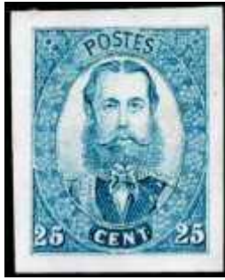
Fig.6: Essay voor Maximiliaan van Mexico

Nu waren er in Milaan op dat moment in ieder geval twee drukkers actief met het ontwerpen van postzegels. In 1861 was het Koninkrijk Italië uitgeroepen en had koning Victor-Emanuel de troon bestegen. Een aantal drukkers leverde daarna, op verzoek van de Italiaanse post, ontwerpen aan voor postzegels voor het nieuwe koninkrijk. Hieronder waren de twee Milanese drukkers, Francesco Grazioli (Wench), die in april 1862 zijn ontwerpen aan de post aanbod en Luigi Ronchi, die in juli 1863 met zijn essays verscheen.