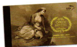
4. Αριθμημένο Τευχίδιο / Numbered Booklet Τιμή / Price: 12,00 €