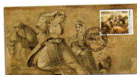
3. Αριθμημένος Ειδικός Αναμνηστικός Φάκελος/ Numbered Special Commemorative Cover Τιμή / Price: 4,50 €