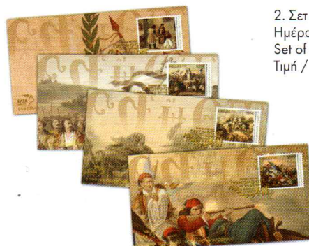
2. Σετ 4 Φακέλων Πρώτης Ημέρας Κυκλοφορίας / Set of 4 First Day Covers Τιμή / Price: 13,00 €