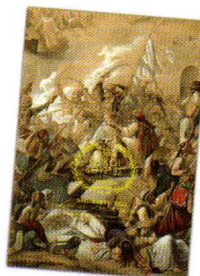
5. Αριθμημένο Λεύκωμα Σειράς/ Numbered Set Album Τιμή / Price: 29,00 €