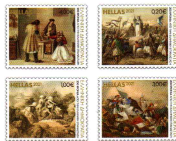
1. Γραμματόσημα / Stamps Τιμή / Price: 8,20 €

ΕΛΛΑΔΑ 1821-2021 ΟΡΚΟΙ & ΘΥΣΙΕΣ ΓΙΑ ΤΗΝ ΕΛΕΥΘΕΡΙΑ ΑΘΗΝΑΙ 25-03-2021